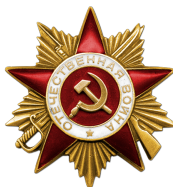
Орден Отечественной войны I степени 1985г.